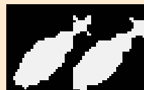
Schema sala spina di pesce

Caratteristica saliente è la conduzione per gruppi delle operazioni di mungitura. Questo semplifica le diverse operazioni di mungitura, che sono eseguite in modo regolare e sequenziale, rende i tempi di routine più rigidi e, quindi